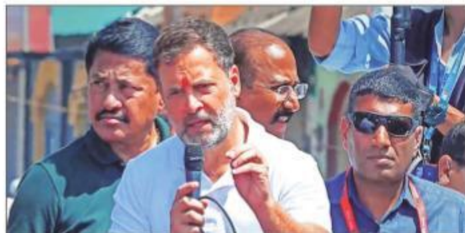
गॅस सिलिंडरचे दर ४०० रुपये असताना नरेंद्र मोदी यांनी महिलांसाठी वाढल्याची ओरड केली होती. आता १,१०० रुपये दर झाला असताना माध्यमेही गाप आहेत. समस्यांऐवजी २४ तास मोदी यांचाच चेहरा दाखवला जात आहे. - राहुल गांधी, नेते, काँग्रेस

धुळे : काँग्रेस सत्तेत आल्यानंतर गरीब महिलांच्या बँक खात्यात दरवर्षी एक लाख रुपये, सरकारी नोकऱ्यांमध्ये महिलांना ५० टक्के आरक्षण अशा आश्वासनांसह 'महिला न्याय पंचसूत्री'ची घोषणा काँग्रेस नेते राहुल गांधी यांनी केली. 'भारत जोडो न्याययात्रे'दरम्यान महिला हक्क परिषदेत ते बोलत होते. गांधी यांचा मुक्काम मंगळवारी रात्री धुळे जिल्ह्यातील (पान २ वर)