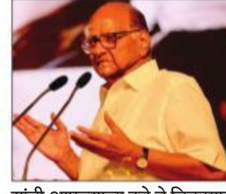
यांनी आपल्याला हवे ते निवडणूक आयुक्त नियुक्तीची व्यवस्था केल्याचे टिकास्त्र राष्ट्रवादींचे

नाशिक : निवडणूक आयुक्त नेमण्यासाठी पूर्वीच्या त्रिस्तरीय समितीच्या रचनेत भाजपने केलेला बदल हा सत्तेचा सरळसरळ गैरवापर आहे. या समितीतून देशाच्या सरन्यायाधीशांना वगळण्याचे कुठलेही कारण नव्हते. आता पंतप्रधान, सत्ताधारी पक्षातील मंत्री व विरोधी पक्षनेता अशी नवी रचना करून पंतप्रधान नरेंद्र मोदी