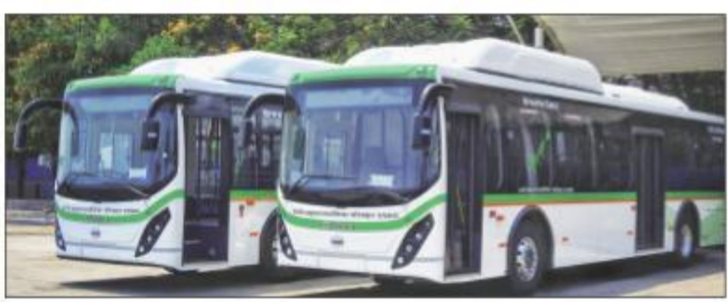
विद्युत बस प्रदूषण नियंत्रण आणि पर्यावरण संरक्षणवार शासनाचा भर आहे. या परिवहन सेवेत नव्या विद्युत बसगाड्यांचा समावेश करण्यात येणार असल्याने शहरामधील हवा प्रदूषणाची पातळी नियंत्रित करणे किंवा कमी करणे शक्य होईल.

मुंबई : मुंबई महानगर क्षेत्रातील (एमएमआर) कल्याण-डोंबिवली, भिवंडी-निजामपूर शहर महापालिका, उल्हासनगर महापालिका, अंबरनाथ नगर परिषद आणि कुळगाव-बदलापूर नगर परिषद यांची संयुक्त परिवहन सेवा स्थान करण्याचा निर्णय बुधवारी राज्य सरकारने घेतला. संयुक्त परिवहन सेवेद्वारे मुंबई महानगर परिसरासाठी रेल्वे व्यतिरिक्त आणखी एक सक्षम सार्वजनिक वाहतूक पर्याय उपलब्ध करून देण्यात येणार मिळेल, असा विश्वास मुख्यमंत्री असल्यामुळे नागरिकांना दिलासा एकनाथ शिंदे यांनी व्यक्त केला. या भागातील लोकांची गरज लक्षात घेऊन हा (पान २ वर)