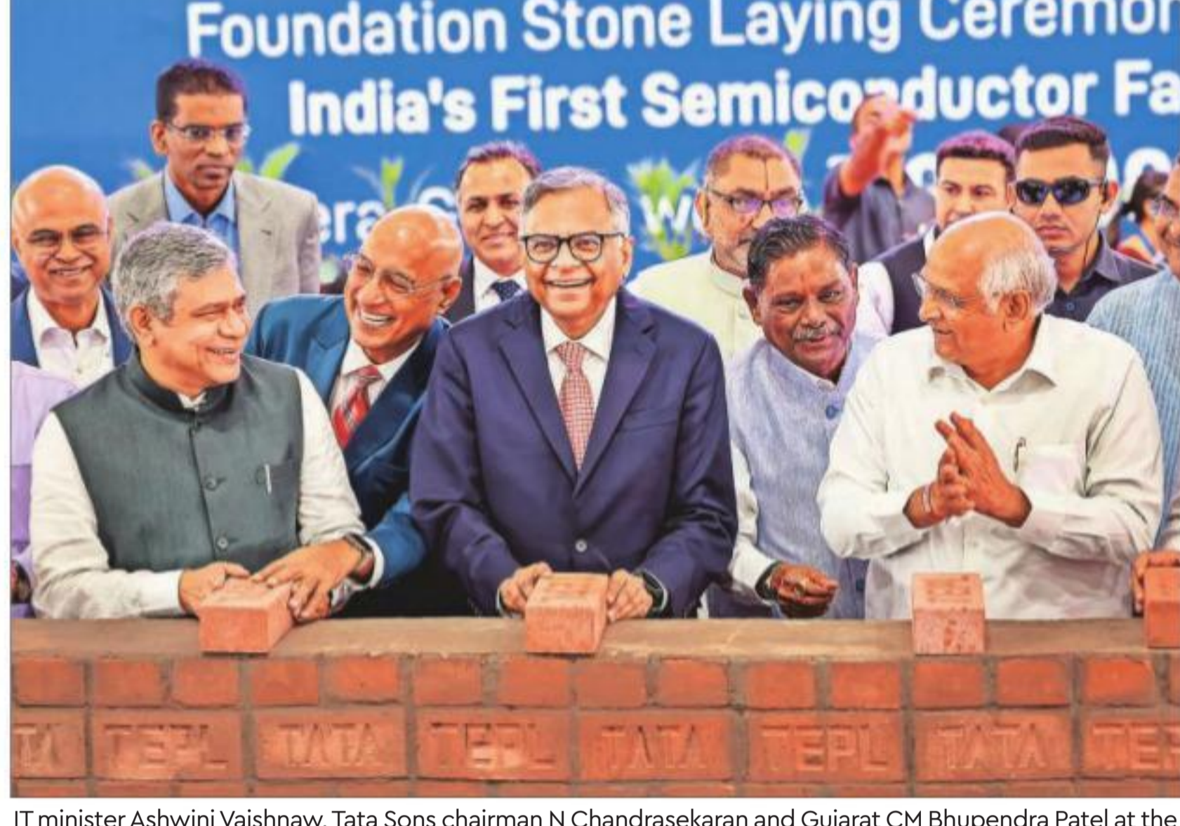
IT minister Ashwini Vaishnav, Tata Sons chairman N Chandrasekaran and Gujarat CM Bhupendra Patel at the groundbreaking ceremony of three semiconductor plants — two in Gujarat and one in Assam — at Dholera in Gujarat, on Wednesday. Vaishnav said the first chip from Dholera will roll out in 2026.